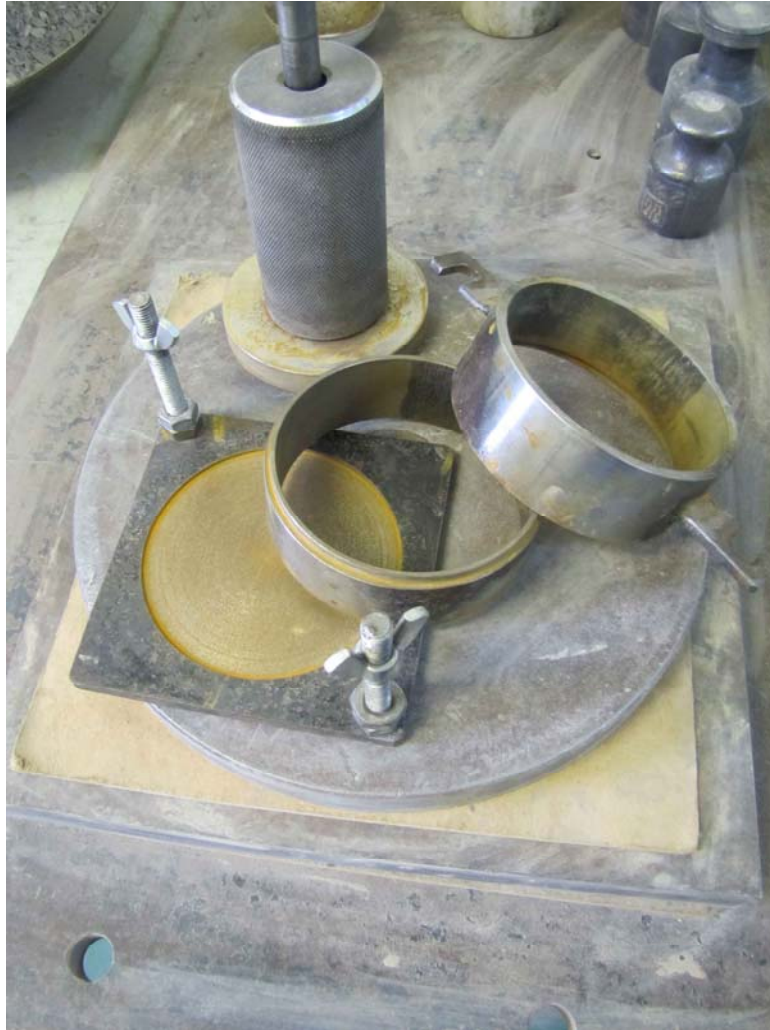
Рис. 4. Комплектація приладу, що пропонується

важливою перевагою пристрою, що пропонується, є можливість його використання при визначенні межі розкочування методом пенетрації, тобто шляхом занурення у ґрунт конуса так само, як і при визначенні верхньої межі пластичності – w_L . Причому в обох випадках повністю виключається вплив людського фактора.