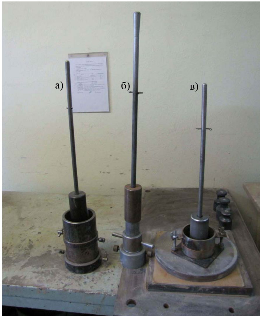
а) за ДСТУ Б В.2.1-12; б) згідно СН 25-74; в) той, що пропонується.