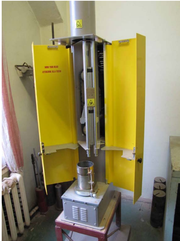
Рис. 2. Вигляд сучасного трамбувального пристрою для підготовки зразків за методом Проктора, AASHTO і для випробування на CBR

досить великого розміру зразків. Варто нагадати, що і «Указання...» [5, стор. 35] і більш пізні, аж до середини 60-х рр., нормативні документи з цього приводу, що були чинними в 50-60-х рр., також рекомендували використання на виробництві аналогічної методики, але вже суто для оцінки вологості ґрунту тільки із використанням ударника Союздорнии (В.И. Волкова). Та ця методика так і не набула широкого застосування.